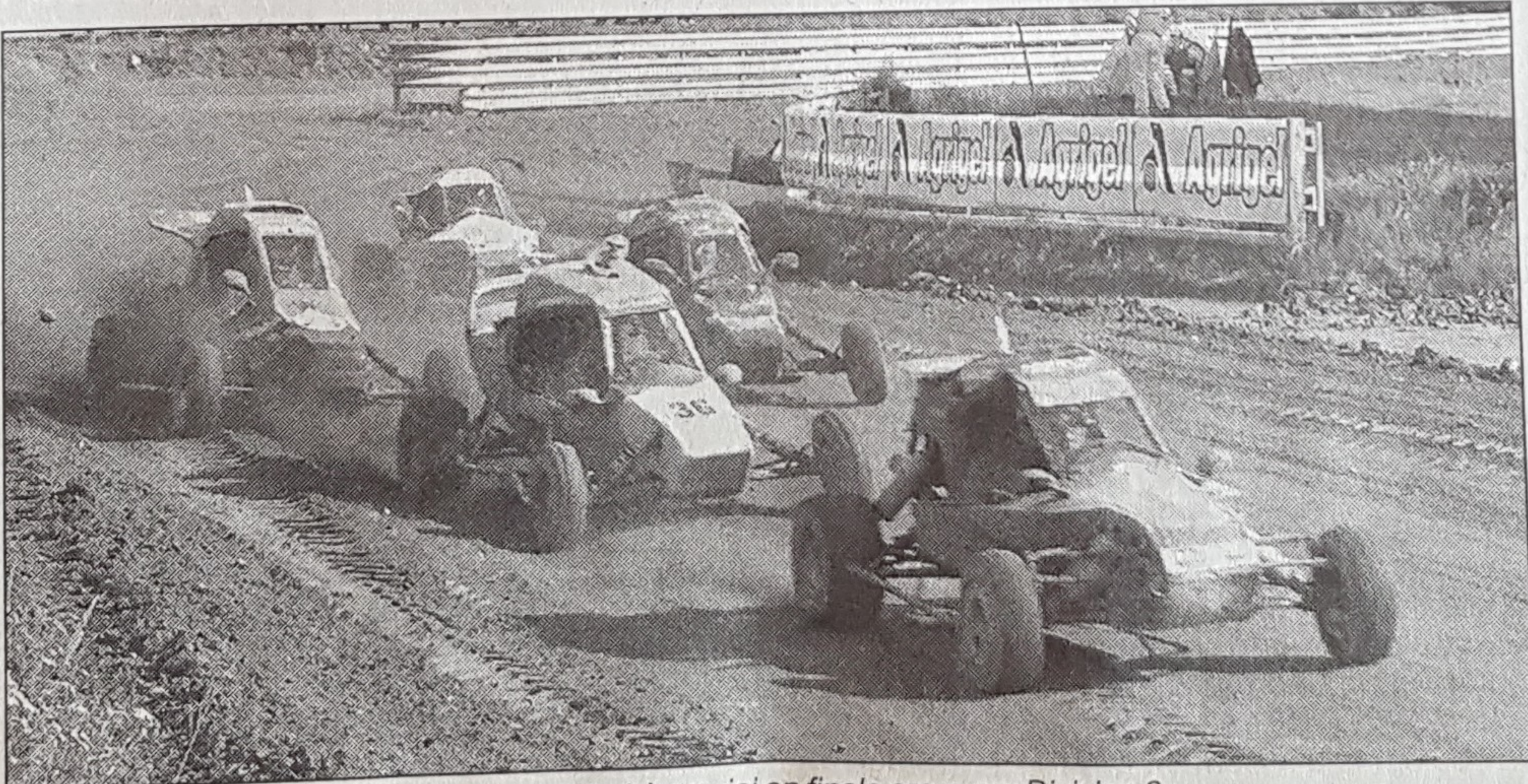
Les places sont chères, ici en finale cross car Division 2.