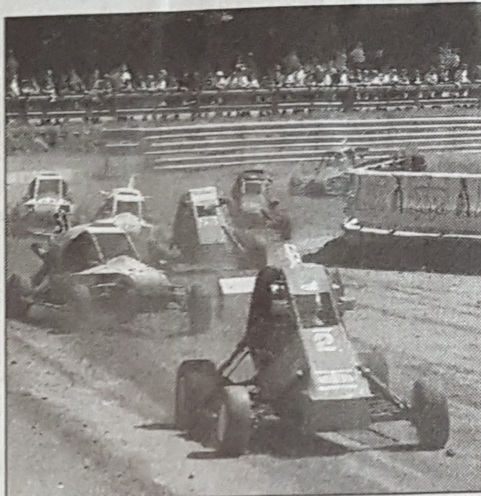
Les Cross Car ont animé le meeting entre les courses de Fol Car.