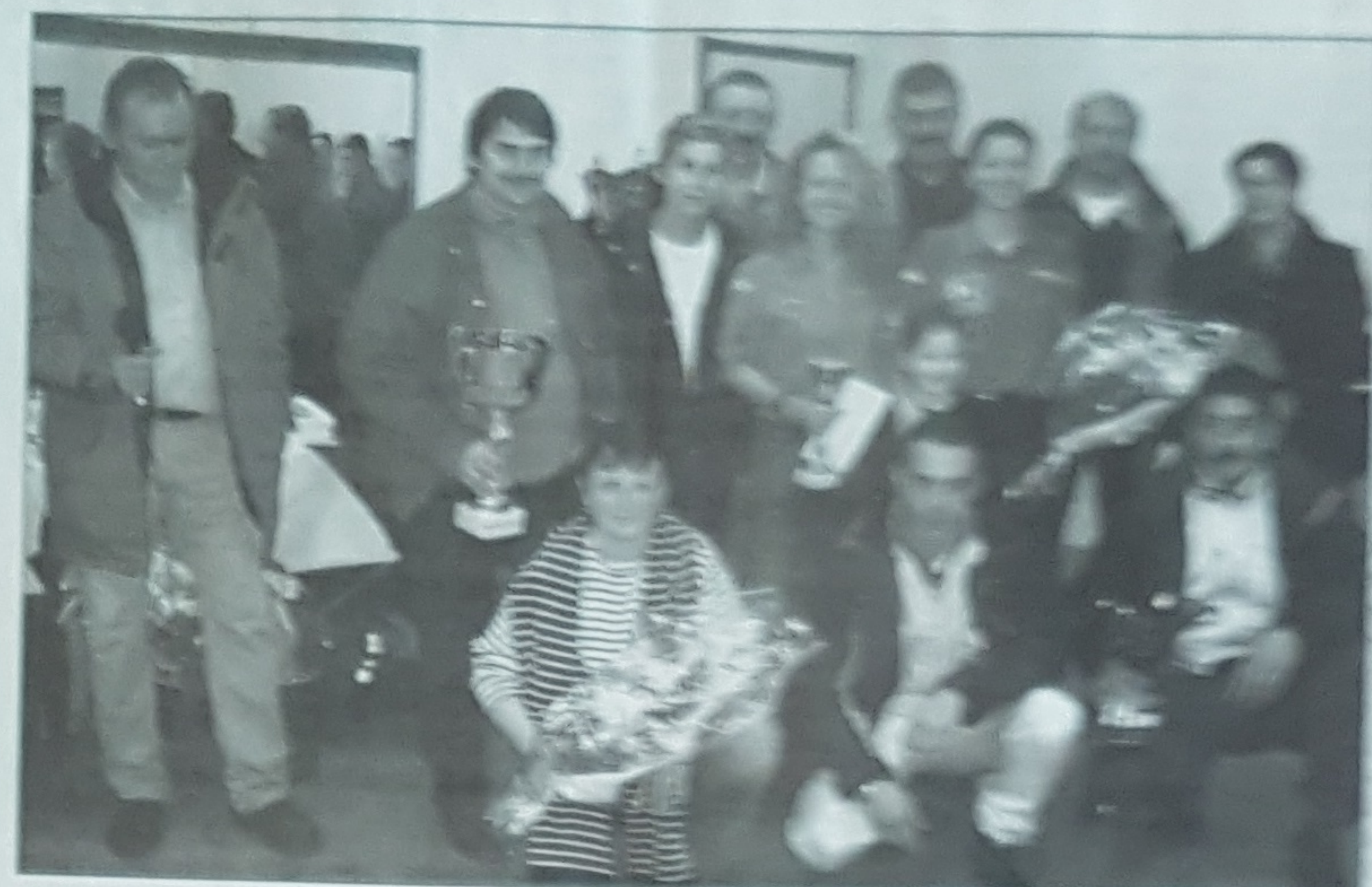
Les vainqueurs scratch au moment des récompenses en compagnie des organisateurs et des élus.

Le groupe N a été le plus disputé. A lui seul, il comportait 50% du plateau avec vingt-