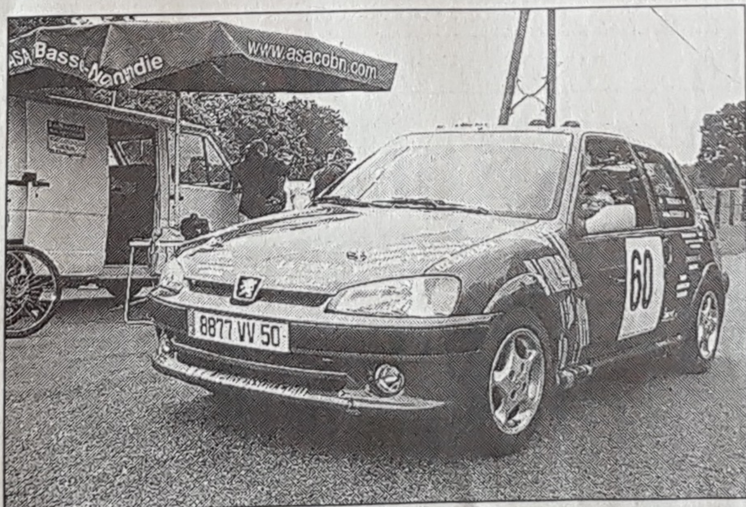
Le Valognais Eric Hourcourigaray terminera à la deuxième place de la classe N 2.