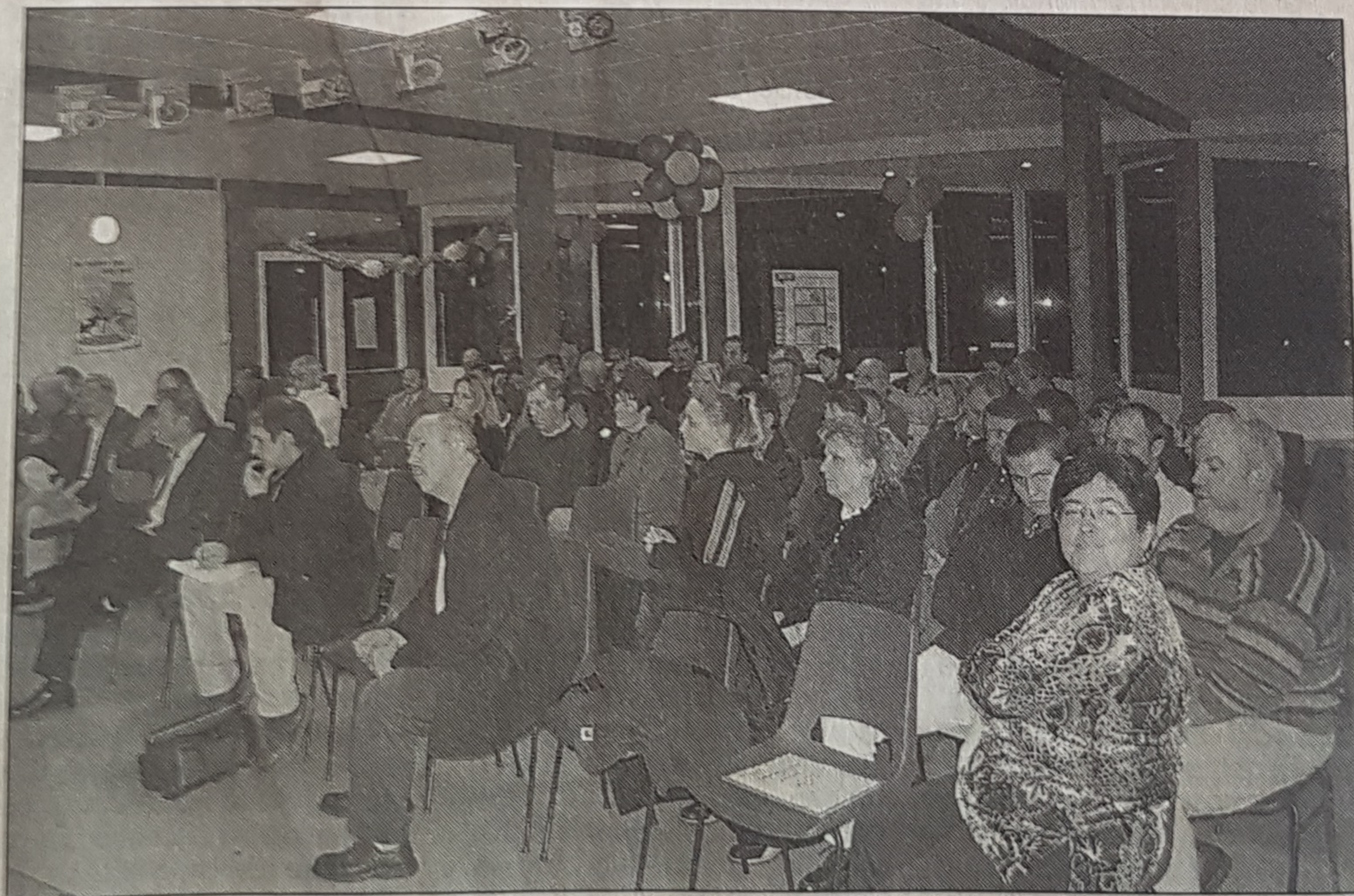
L'assistance attentive pendant le bilan moral de l'association.

30 juin : Fol car - cross car de Picauville.