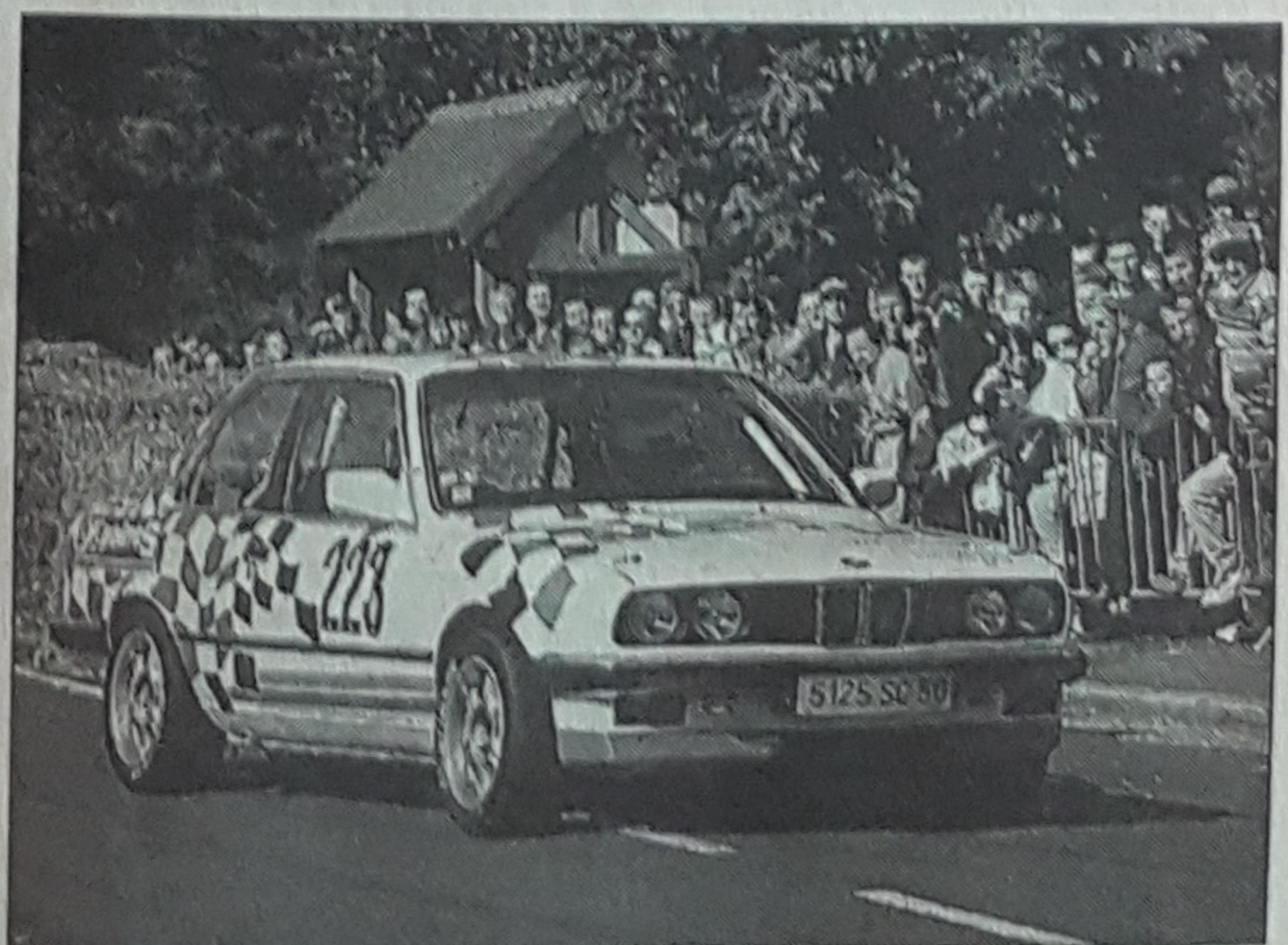
Sylvain Renouf, deuxième dans la catégorie groupe A.

Classement inter écuries : 1. ORN Ecurie ; 2. Léopard ; 3. BHAC ; 4. Villedieu Auto Club ; 5. Cotentin Auto Club ; 6. ACSM ; 7. Saint-Lô auto club ; 8. Ouest 50.