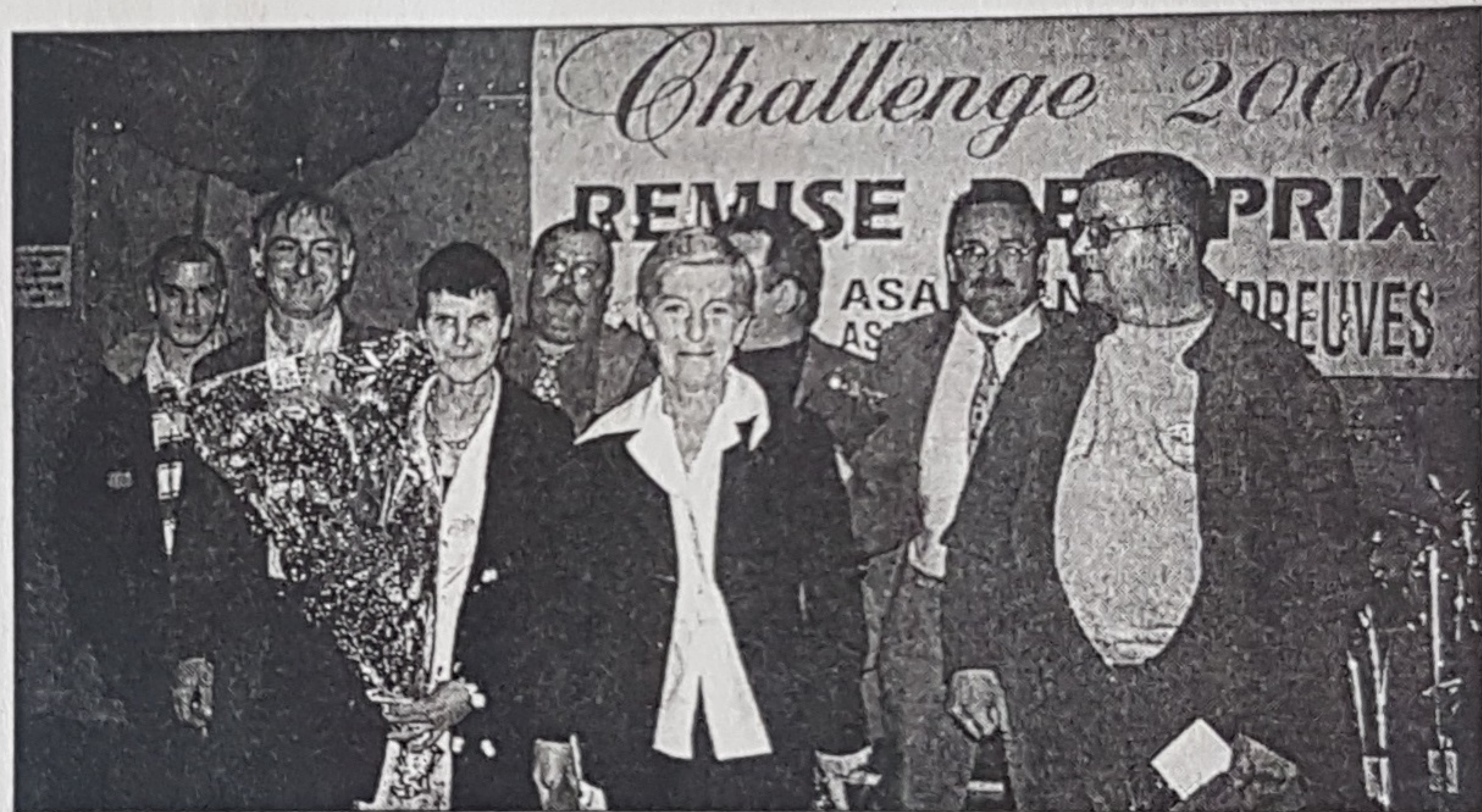
Une palette de commissaires passionnés que l'on a souvent vus au bord des pistes cette saison.