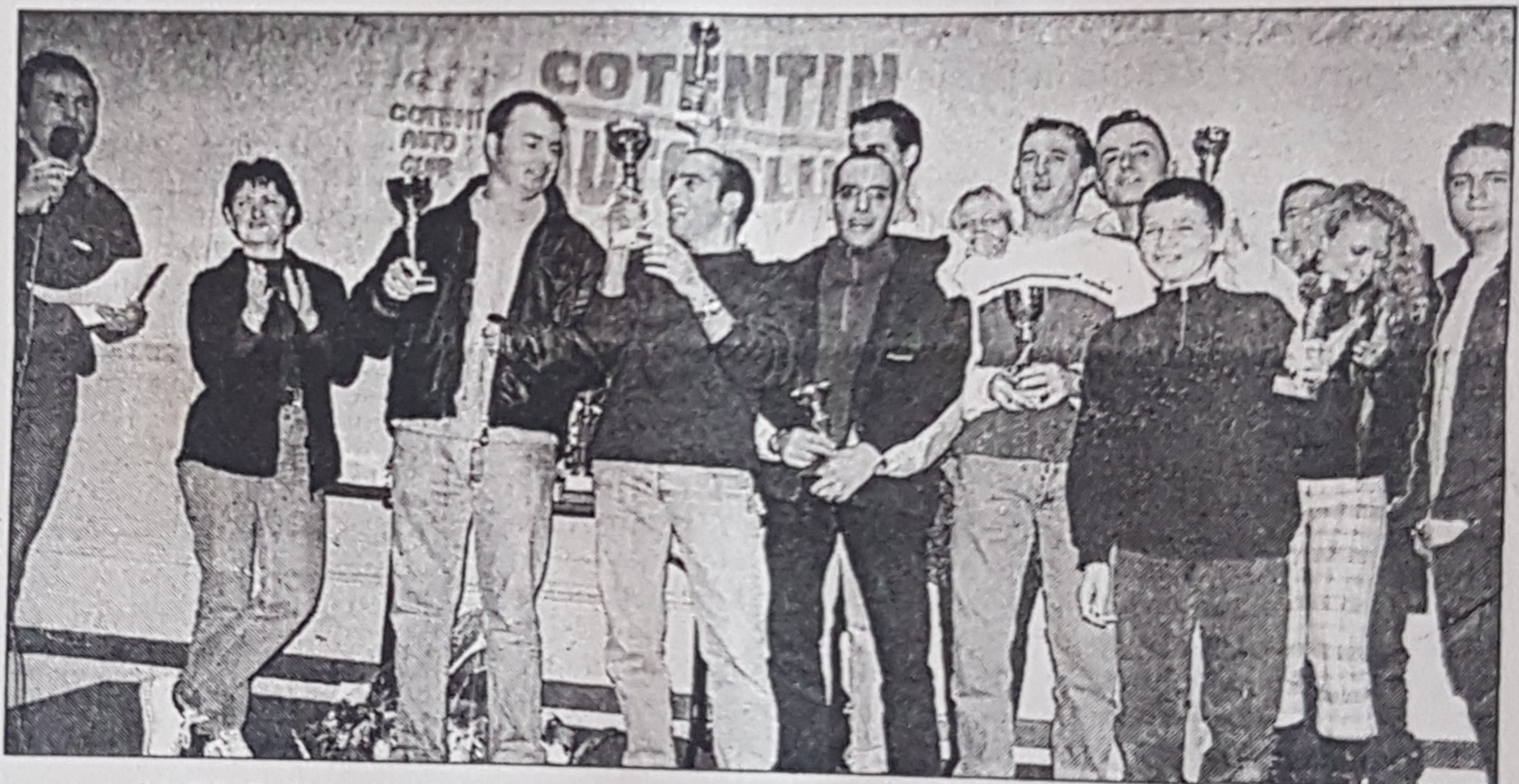
Les bénévoles ont aussi été récompensés par l'organisateur. Ici la troupe des rôti-seurs.

marré et la première manche s'est déroulée entre 12 et 14 heures pour satisfaire l'en-