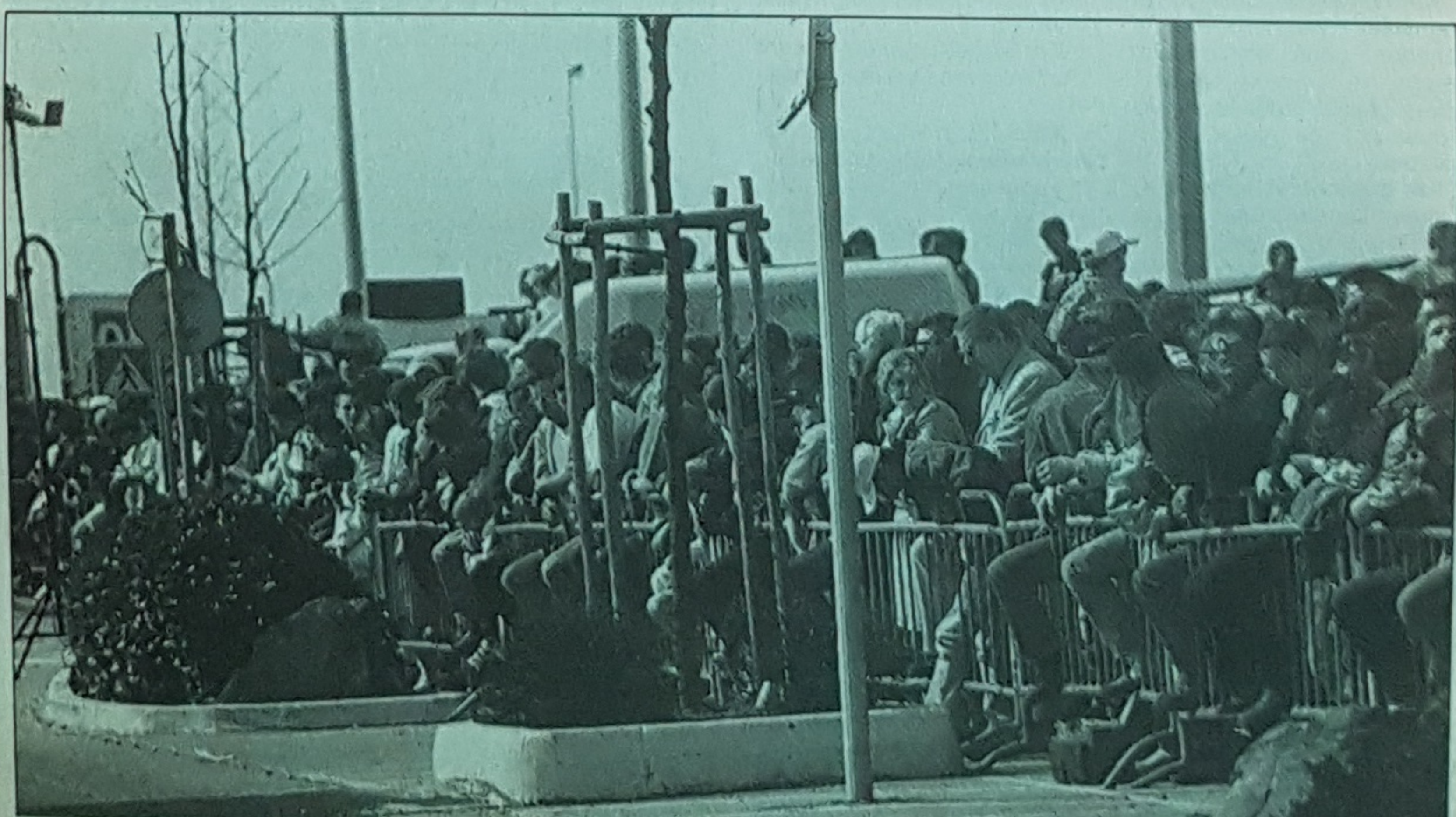
Le public a répondu présent une fois de plus pour ce slalom de Cherbourg.