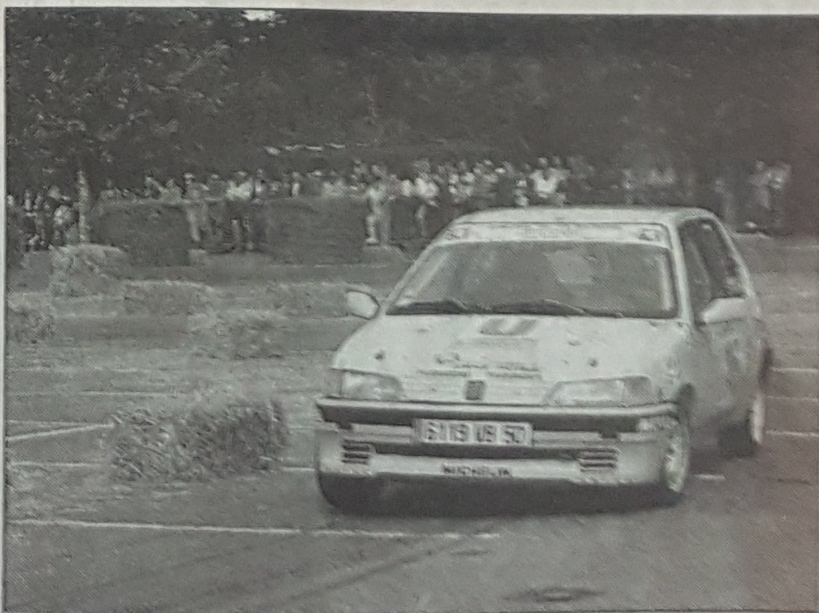
Eric Hourcourgaray du Cotentin Auto Club place sa petite 106 en deuxième position de la classe A5.